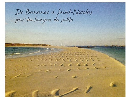
De Bananec à Saint-Nicolas par la langue de sable

Au milieu du siècle passé une poignée de passionnés créa l'école de voile et le centre nautique des Glénans afin d'enseigner la voile au plus grand nombre. Réputée dans le monde entier pour la rigueur de ses enseignements et la modestie de ses tarifs, elle accueille chaque année des milliers de stagiaires.