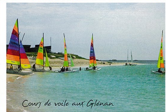
Cours de voile aux Glénan