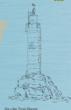
Feu des Trois Pierres